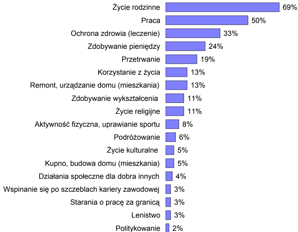
RYS. 2. KTÓRY Z WYMIENIONYCH RODZAJÓW DZIAŁALNOŚCI STANOWI OBECNIE TREŚĆ PANA(I) ŻYCIA CODZIENNEGO? CZEMU POŚWIĘCA PAN(I) NAJWIĘCEJ CZASU I ENERGII?

Procenty nie sumują się do 100, ponieważ badani mogli wybrać trzy odpowiedzi