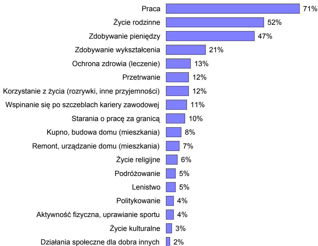
RYS. 1. CZEMU OBECNIE NAJGORLIWIWEJ POŚWIĘCAJĄ SIĘ LUDZIE, KTÓRYCH PAN(I) ZNA, KTÓRYCH PAN(I) SPOTYKA NA CO DZIEŃ?

Procenty nie sumują się do 100, ponieważ badani mogli wybrać trzy odpowiedzi