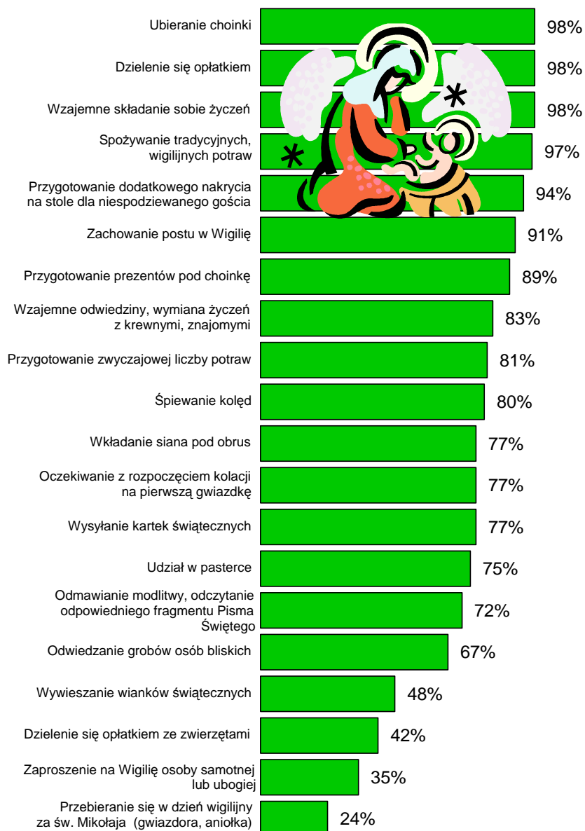
RYS. 1. KTÓRE Z PONIŻSZYCH ZWYCZAJÓW WIGILIJNYCH ZACHOWYWANE SĄ W PANA(I) RODZINIE?