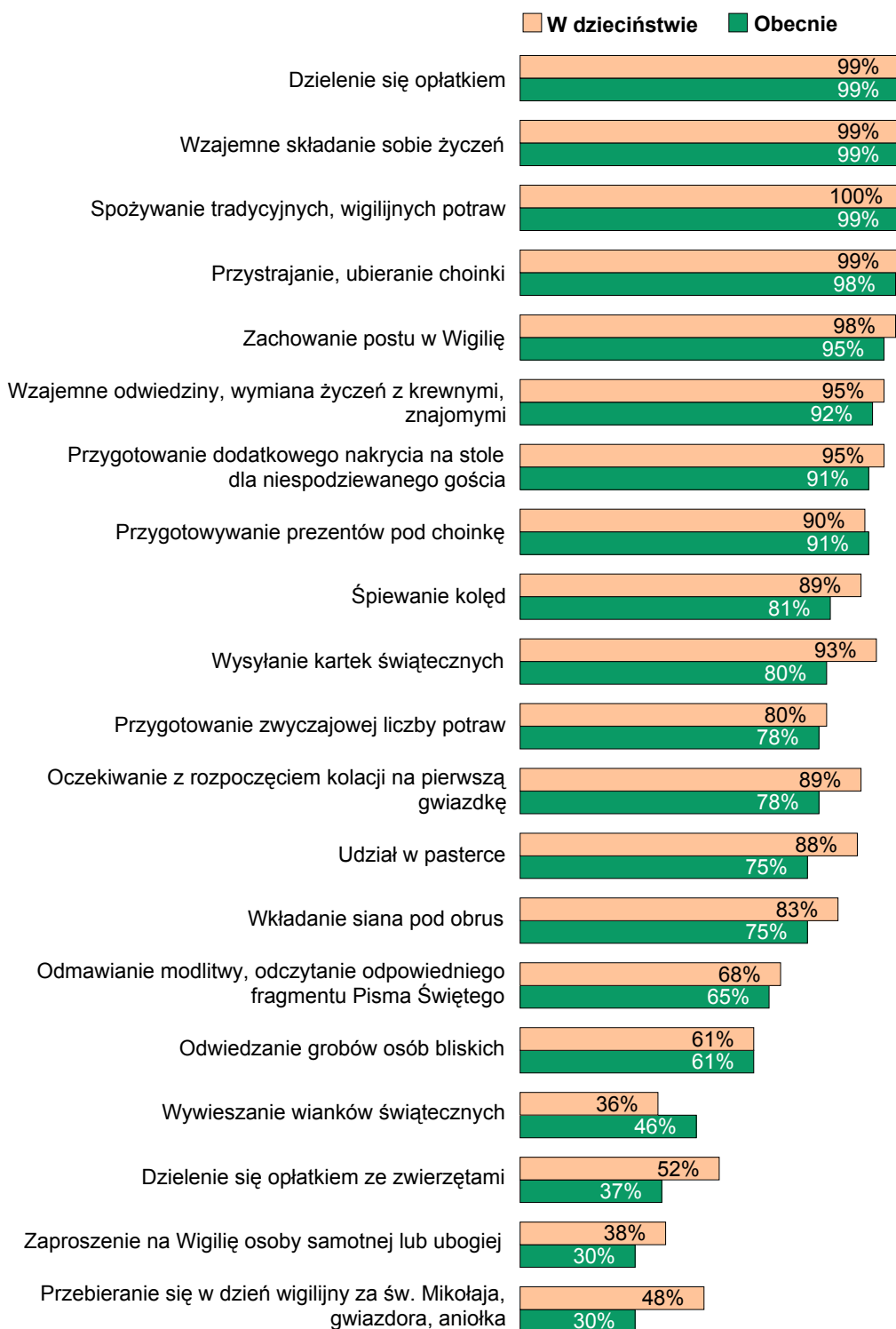
RYS. 1. JAKIE ZWYCZAJE ŚWIĄTECZNE BYŁY/ SĄ ZACHOWYWANE W PANA(I) RODZINIE?