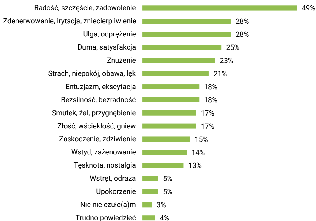
RYS. 1. Codziennie odczuwamy różne emocje. Jakie uczucia, emocje towarzyszyły Panu(i) wczoraj?