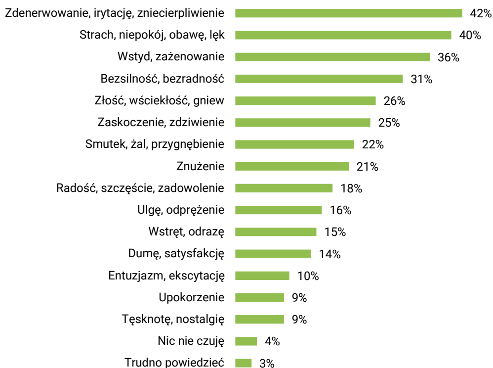
RYS. 2. A co Pan(i) czuje, kiedy myśli Pan(i) o bieżącej sytuacji w Polsce?