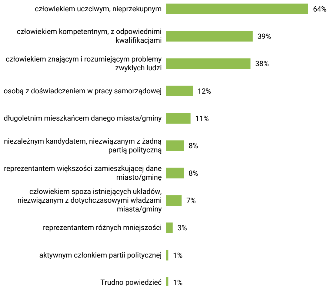
RYS. 2. Które z cech idealnego prezydenta miasta, burmistrza, wójta są, Pana(i) zdaniem, najważniejsze? Czy najważniejsze jest to, żeby był:

Odsetki nie sumują się do 100%, bo badani mogli wskazać dwie cechy