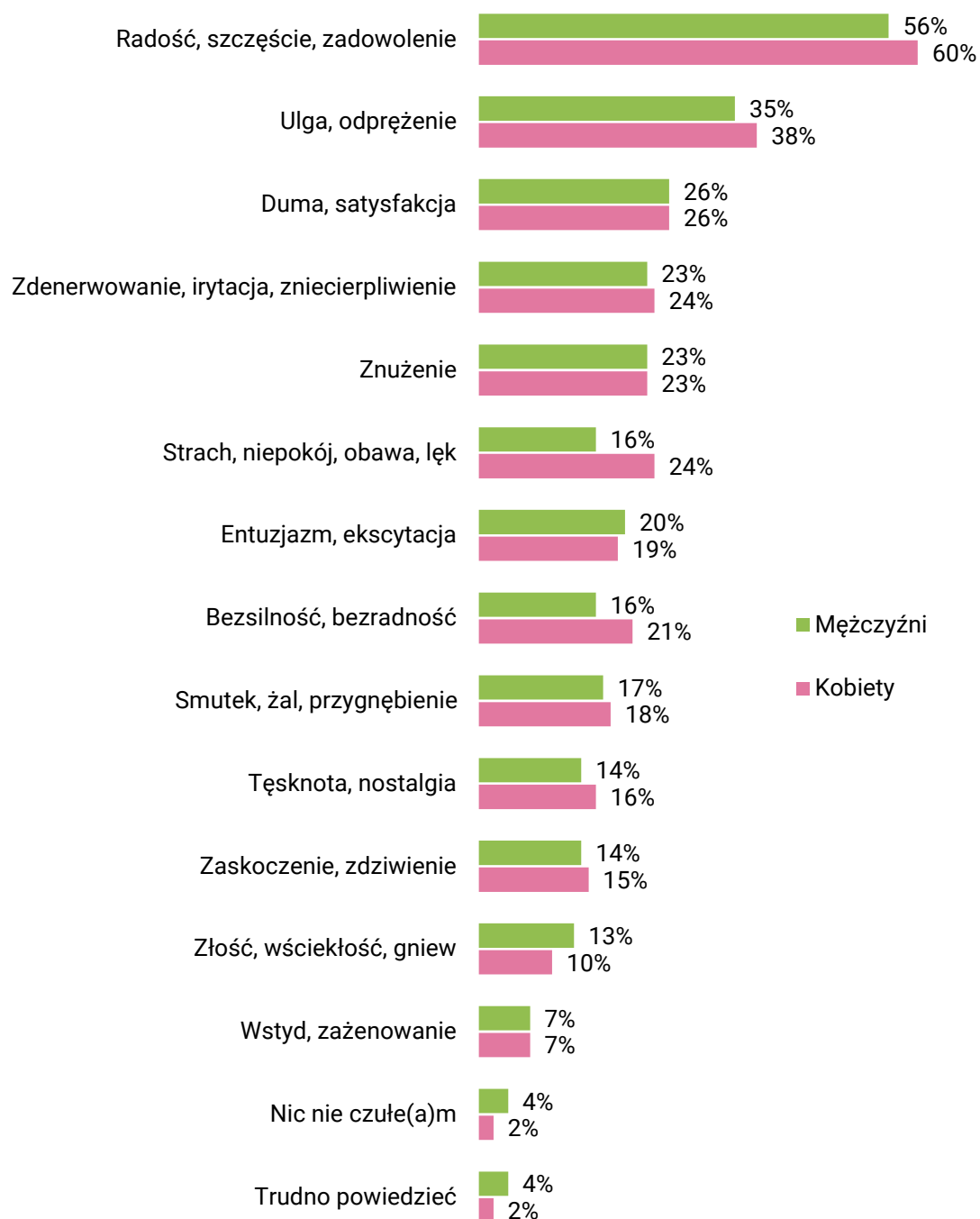
RYS. 5. Jakie uczucia, emocje towarzyszyły Panu(i) wczoraj?