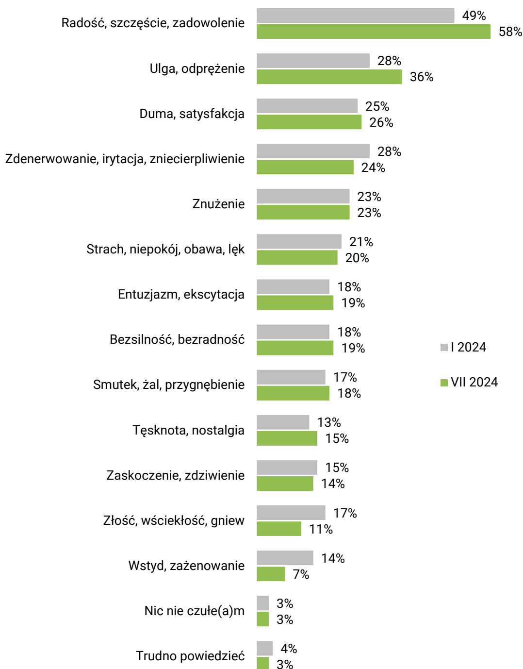
RYS. 3. Codziennie odczuwamy różne emocje. Jakie uczucia, emocje towarzyszyły Panu(i) wczoraj?