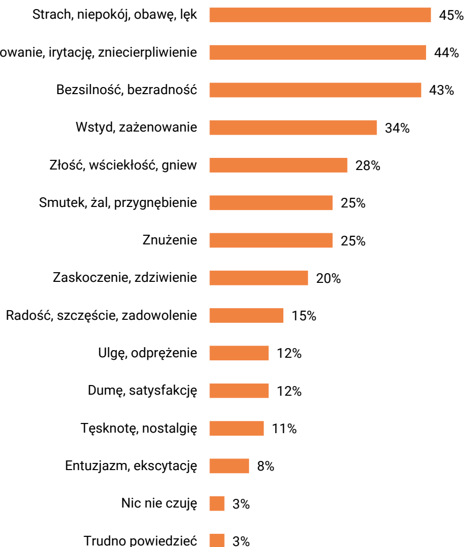
RYS. 2. A co Pan(i) czuje, kiedy myśli Pan(i) o bieżącej sytuacji w Polsce?