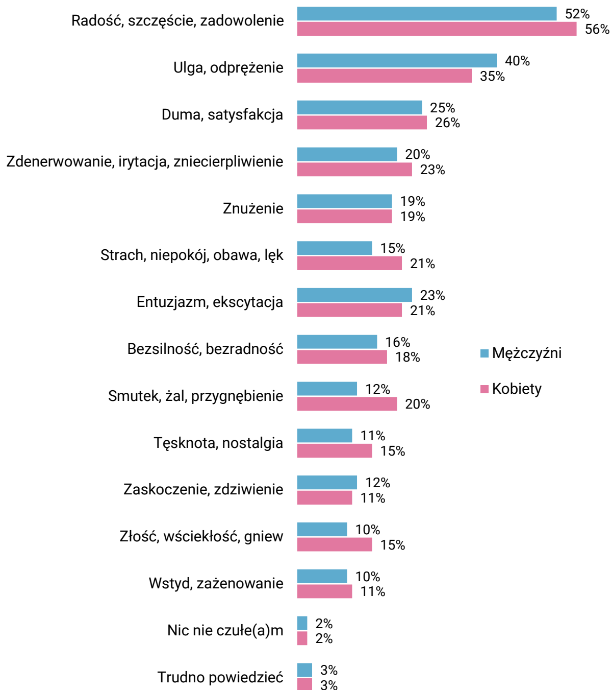
RYS. 5. Jakie uczucia, emocje towarzyszyły Panu(i) wczoraj?