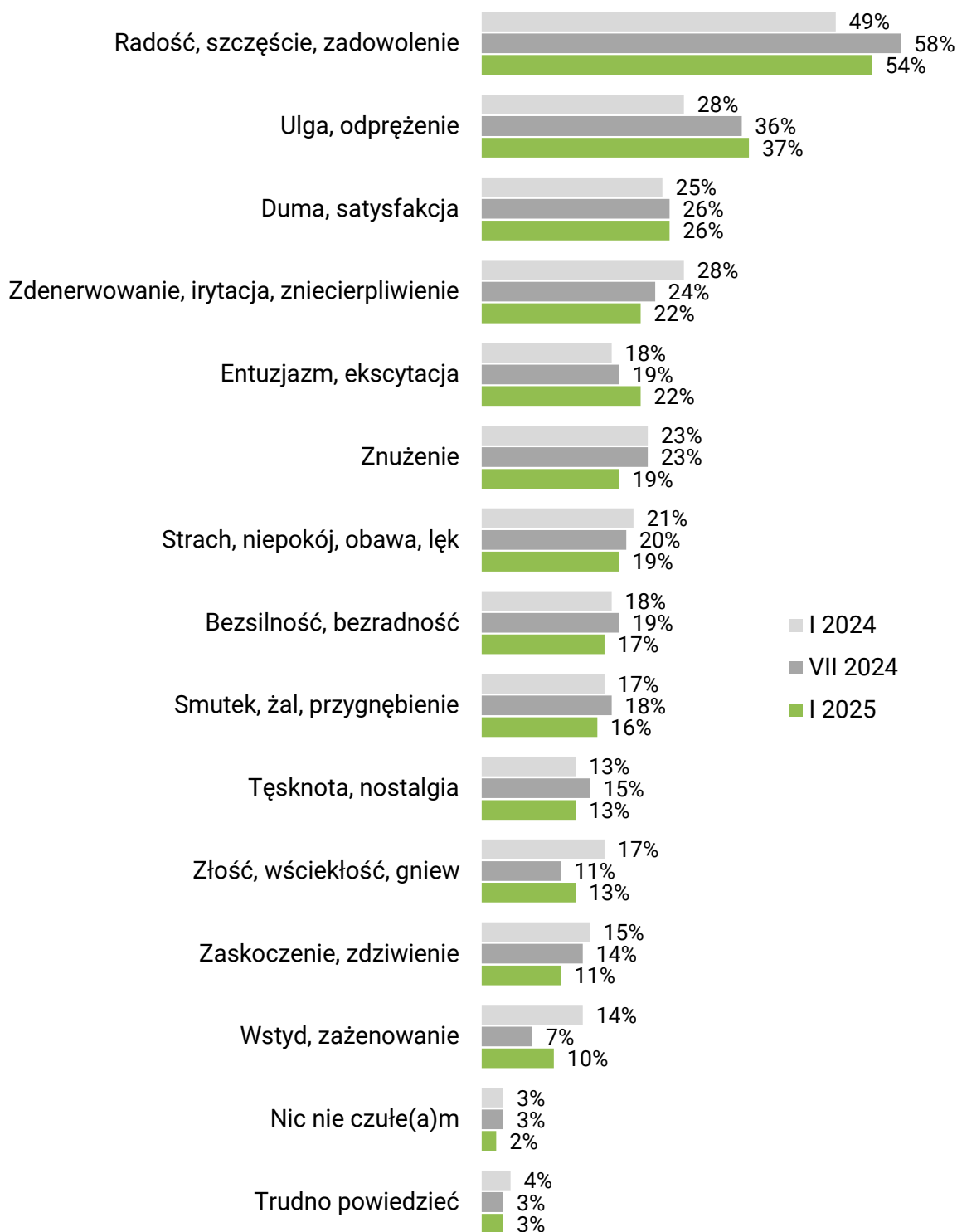
RYS. 3. Codziennie odczuwamy różne emocje. Jakie uczucia, emocje towarzyszyły Panu(i) wczoraj?