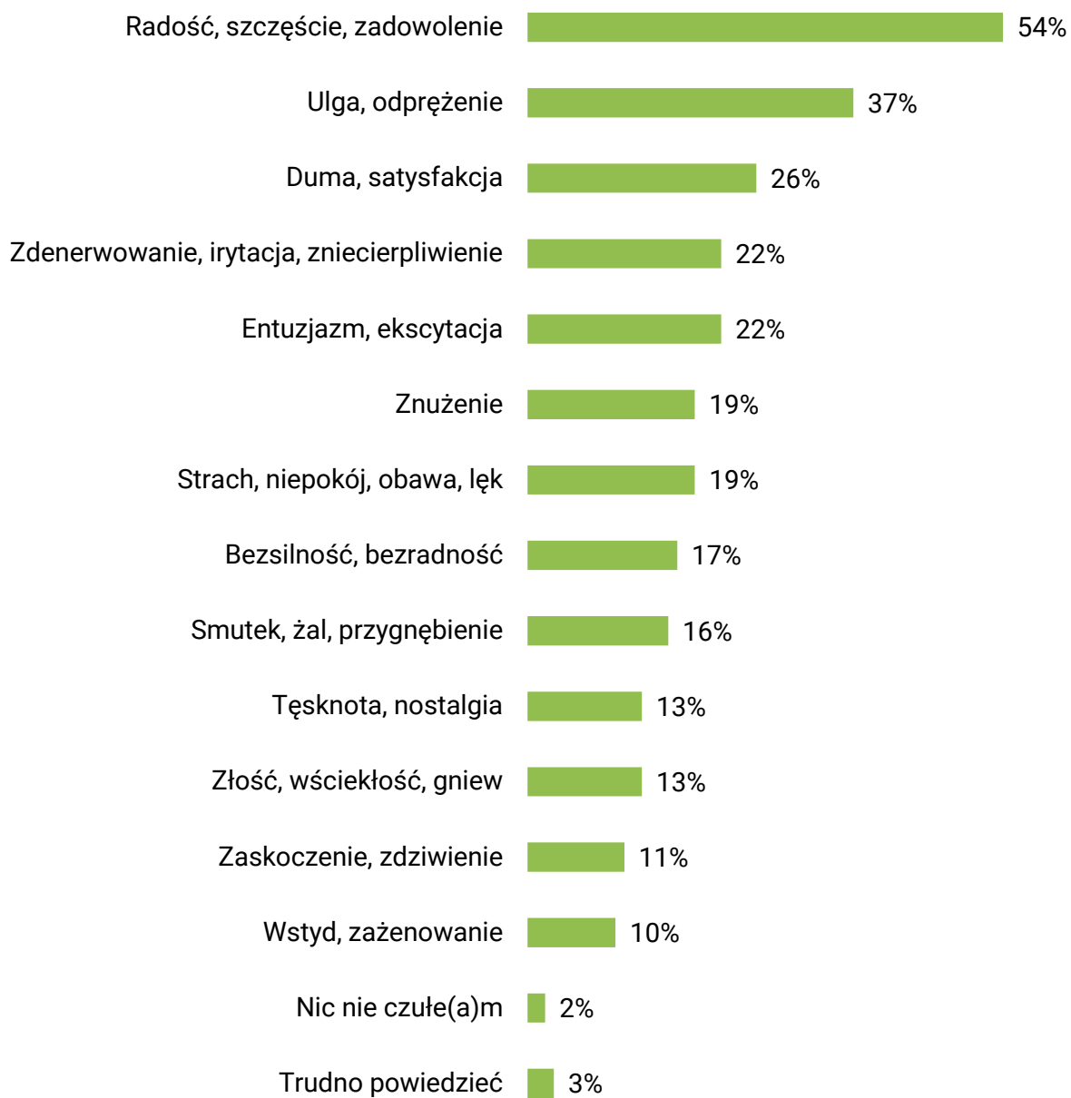
RYS. 1. Codziennie odczuwamy różne emocje. Jakie uczucia, emocje towarzyszyły Panu(i) wczoraj?