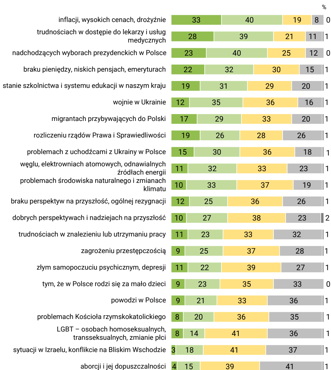
RYS. 1. Jak często w ciągu ostatnich dwóch tygodni w Pana(i) bliskim otoczeniu, np. w rodzinie, wśród przyjaciół, znajomych, sąsiadów mówiło się o: