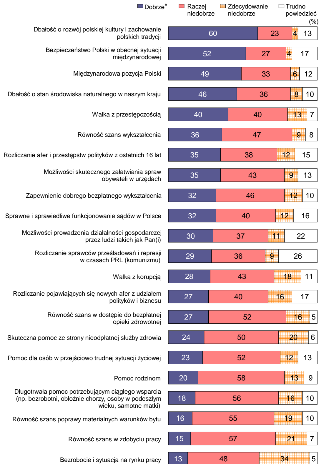
RYS. 2. JAK PAN(I) OCENIA OBECNĄ SYTUACJĘ W POLSCE W NASTĘPUJĄCYCH DZIEDZINACH?