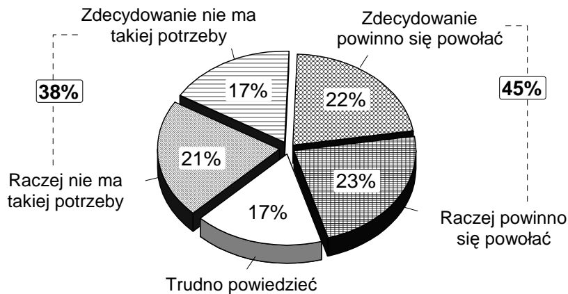
RYS. 3. CZY, PANA(I) ZDANIEM, POWINNO SIĘ POWOŁAĆ SEJMOWĄ KOMISJĘ ŚLEDCZĄ W SPRAWIE DZIAŁAŃ CBA (CENTRALNEGO BIURA ANTYKORUPCYJNEGO), KTÓRE DOPROWADZIŁY DO DYMISJI ANDRZEJA LEPPERA Z FUNKCJI WICEPREMIERA I MINISTRA ROLNICTWA, CZY TEŻ NIE MA TAKIEJ POTRZEBY?

Za powołaniem specjalnej komisji w tej sprawie opowiadają się przede wszystkim zadeklarowani sympatycy LiS (63%), a także wyborcy niezdecydowani, którym być może tego rodzaju śledztwo ułatwiłoby wybór (52%). Mniej stanowczo za utworzeniem komisji śledczej w tej sprawie optują wyborcy PO (51%), przy czym spora liczba zwolenników tego ugrupowania (41%) uważa, że powoływanie kolejnej komisji parlamentarnej nie jest potrzebne. Wśród wyborców LiD połowa (51%) sądzi, że tworzenie takiej komisji jest zbyteczne, a nieco mniej (45%) chciałoby jej powołania. Najbardziej zdecydowanymi przeciwnikami tworzenia komisji w tej sprawie są zadeklarowani wyborcy PiS (56% głosów sprzeciwu), jednak także wśród nich ponad jedna trzecia (36%) chciałaby, aby posłowie śledczy wyjaśnili wszystkie okoliczności akcji CBA w Ministerstwie Rolnictwa.