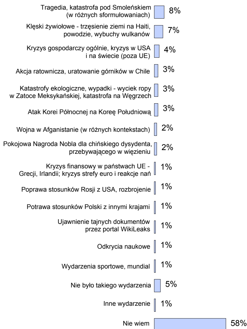
RYS. 2. WYDARZENIE ROKU 2010 ZA GRANICĄ

Procenty nie sumują się do 100, ponieważ badani mogli wymieniać różne wydarzenia