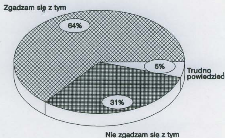
RYS. 2. ROZKŁAD ODPOWIEDZI NA PYTANIE: JAKI JEST PANA (I) STOSUNEK DO POWIEDZENIA: "JAK ŚWIAT ŚWIATEM NIEMIEC POLAKOWI NIGDY NIE BĘDZIE BRATEM"?

Można przyjąć, że akceptacja tego porzekadła jest równoznaczna z brakiem zaufania do Niemców i pesymistycznym nastawieniem do możliwości poprawy stosunków między naszymi narodami. Jak wskazują dane, w porównaniu z rokiem ubiegłym uczucie to nasiliło się i zbliżyło do poziomu z roku 1990 5 (tab. 8).