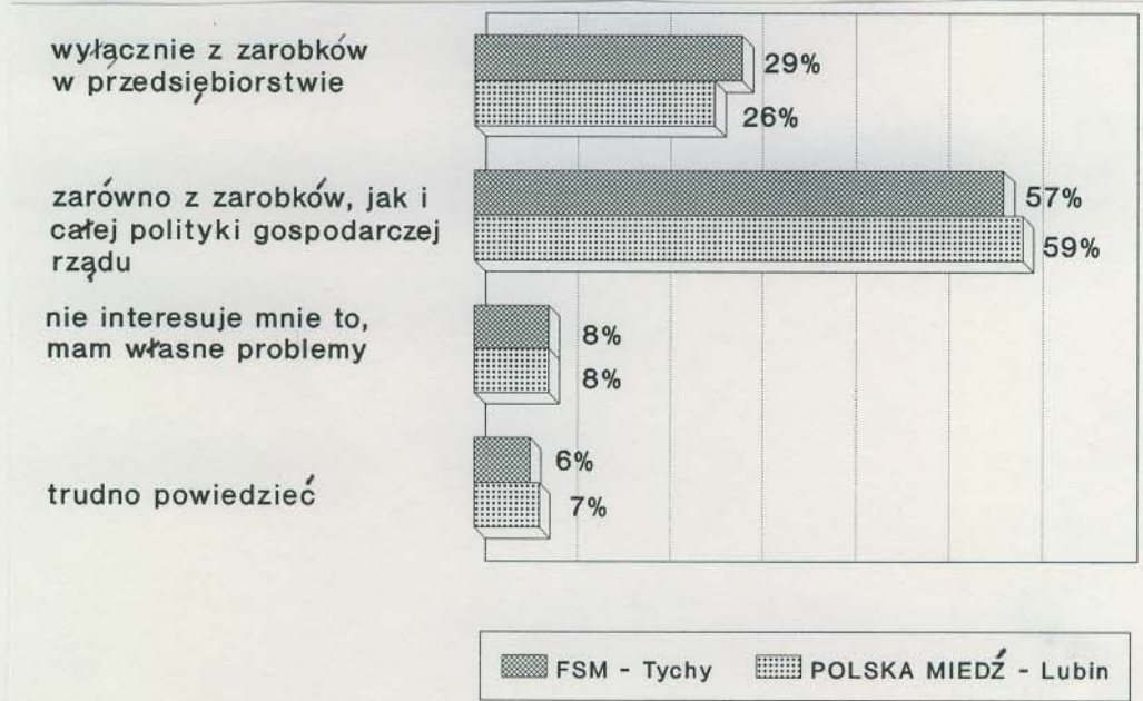
Rys. 1. Rozkład odpowiedzi na pytanie: Czy Pana(i) zdaniem, strajki w [wymieniona nazwa zakładu] są wynikiem niezadowolenia:

Warto dodać, że w lutym ubiegłego roku, w okresie fali strajków tzw. popiwkowych, w odpowiedziach na podobne, choć nie w pełni porównywalne pytanie, przewaga opinii o innym niż tylko placowym charakterze ówczesnych strajków była mniejsza - wynosiła 10 punktów procentowych.