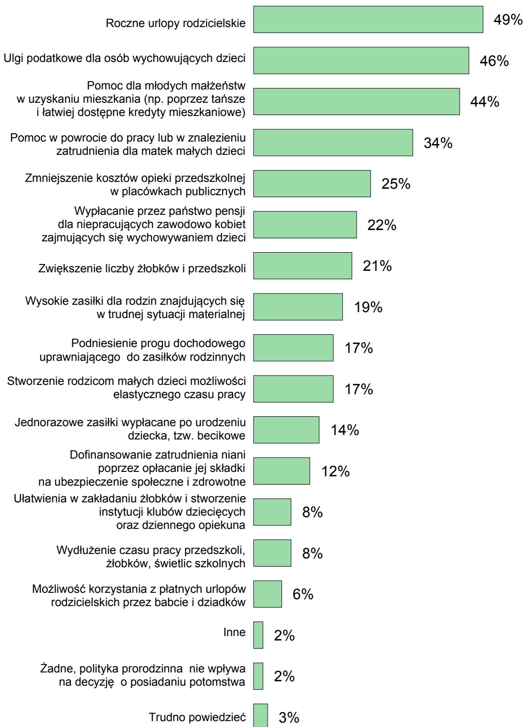
RYS. 2. JAKIE FORMY WSPIERANIA RODZINY, OBECNIE FUNKCJONUJĄCE LUB POSTULOWANE, UWAŻA PAN(I) ZA NAJBARDZIEJ ZACHĘCAJĄCE MŁODYCH LUDZI DO POSIADANIA DZIECI?

Procenty nie sumują się do 100, ponieważ respondenci mogli wskazać więcej niż jedną odpowiedź