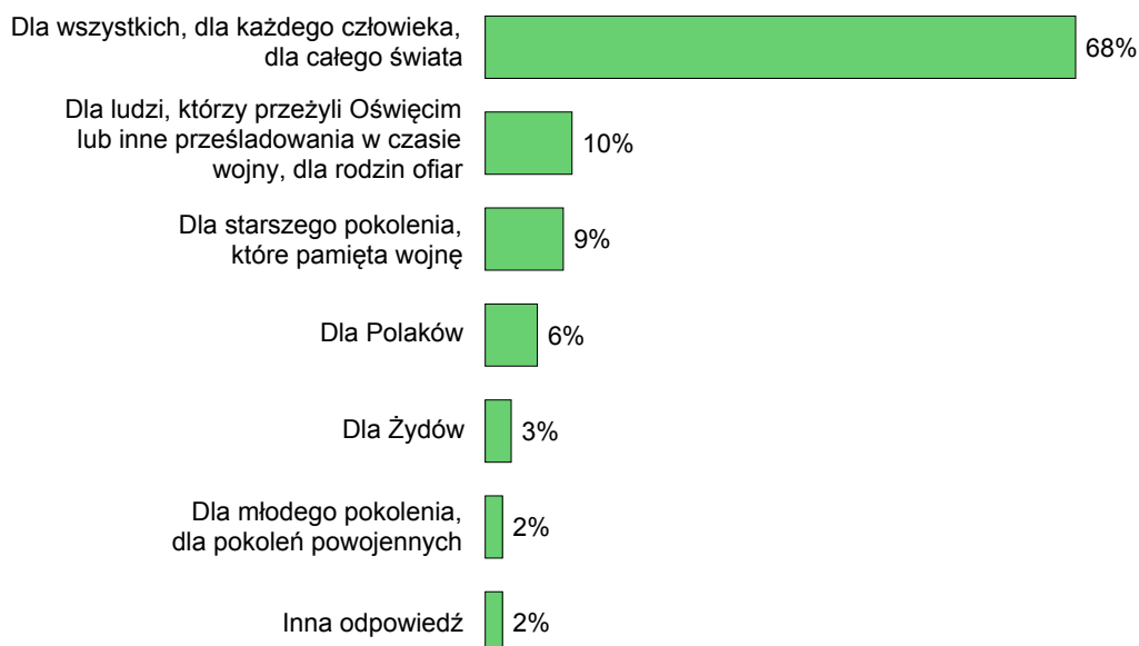
RYS. 3. JAK PAN(I) SĄDZI, DLA KOGO, DLA JAKICH LUDZI JEST DZISIAJ WAŻNA PAMIĘĆ O OŚWIĘCIMIU?

Inny niż przed laty sposób zadawania tego pytania uniemożliwia bezpośrednie zestawienie wyników, można jednak powiedzieć, że przekonanie większości badanych o uniwersalnym – ponadnarodowym i ponadpokoleniowym wymiarze tego, co wydarzyło się w obozie Auschwitz-Birkenau, jest niezmiennie.