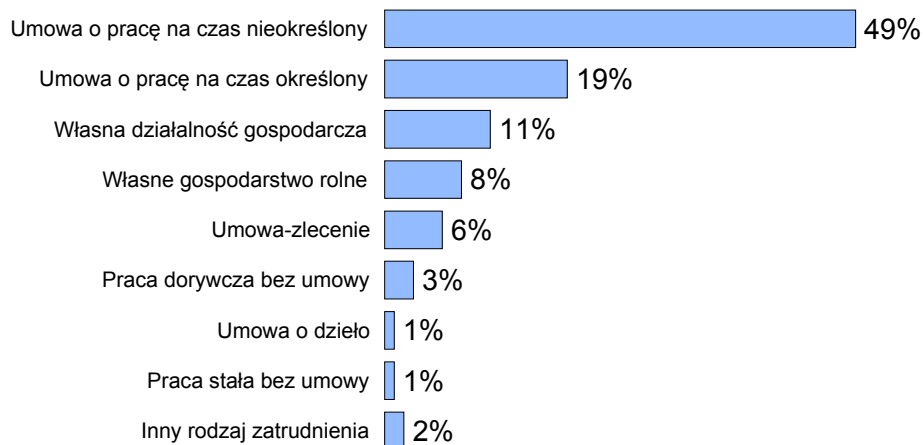
RYS. 3. KTÓRY Z WYMIENIONYCH SPOSOBÓW ZATRUDNIENIA STANOWI GŁÓWNE ŹRÓDŁO PANA(I) DOCHODÓW?

Jeżeli uwzględnić społeczno-demograficzne zróżnicowanie występowania określonych form zatrudnienia, okazuje się, że nie bez znaczenia w tym względzie jest przede wszystkim poziom wykształcenia pracujących, ich pozycja zawodowa, wiek, a poniekąd także miejsce zamieszkania i płeć. Umowa o pracę na czas nieokreślony najczęściej jest domeną osób z wyższym wykształceniem, kadry kierowniczej oraz specjalistów wyższego i średniego szczebla, a także pracowników administracyjno-biurowych. Wyraźnie częściej niż inni taką formą zatrudnienia charakteryzują się także mieszkańcy dużych, ale nie największych miast oraz osoby mające od 35 do 54 lat. Nieco częściej są to kobiety niż mężczyźni.