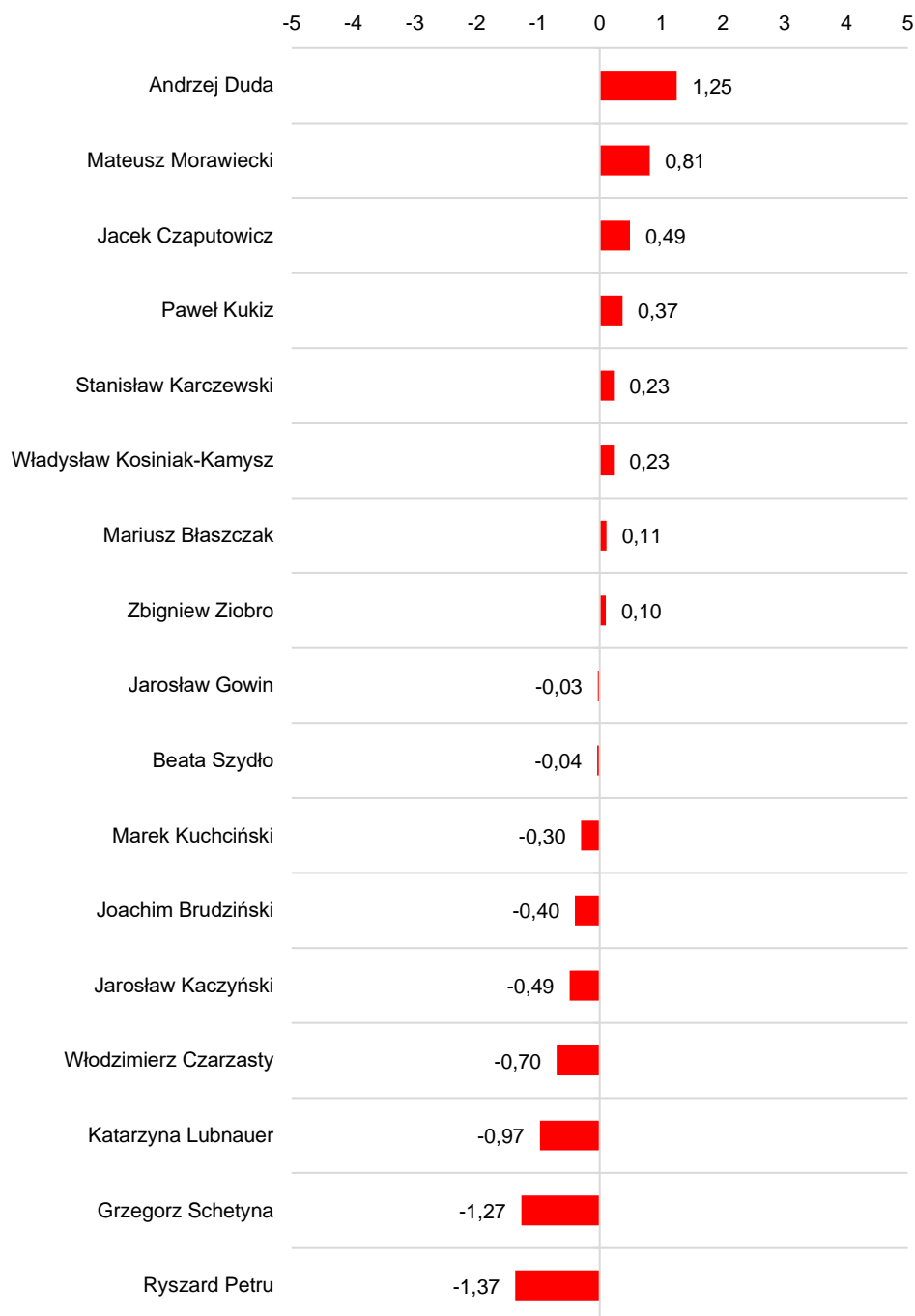
RYS. 1. Zaufanie do polityków w grudniu 2018 – średnie na skali od -5 (głęboka nieufność) do +5 (pełne zaufanie)