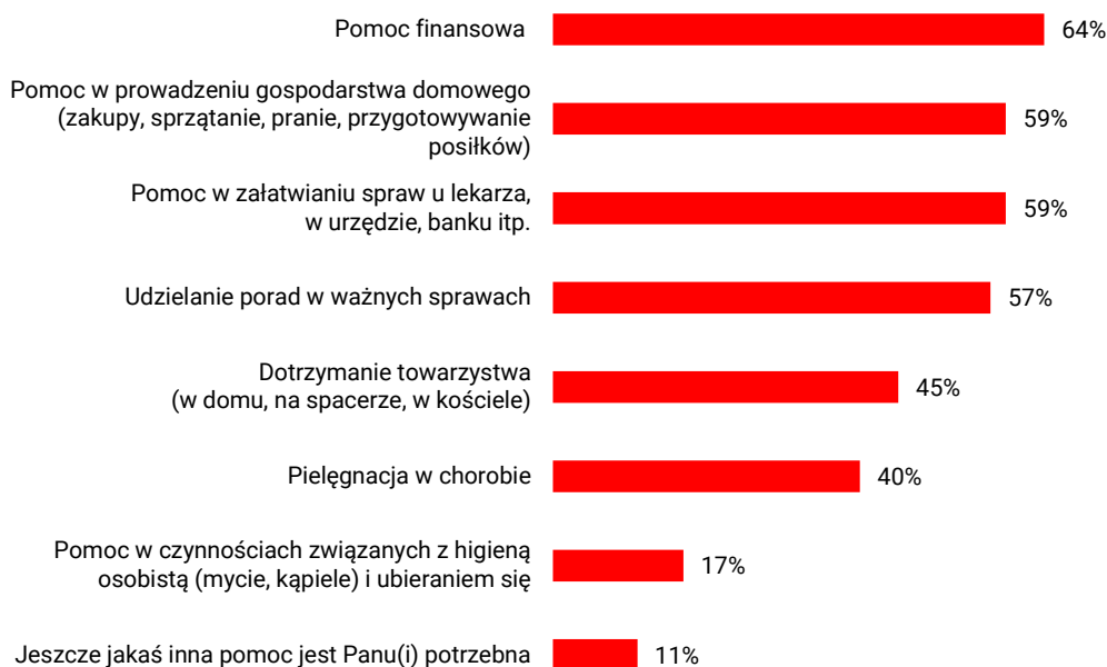
RYS. 3. Jaka pomoc jest Panu(i) potrzebna? N=127

Najczęściej w tym kontekście wymieniane było wsparcie finansowe (64%), a w następnej kolejności: pomoc w prowadzeniu gospodarstwa domowego (59%), załatwianiu spraw u lekarza, w urzędzie, w banku itp. (59%) oraz udzielanie porad (57%). Znaczna część badanych wymagających wsparcia chciałaby, aby ktoś dotrzymywał im towarzystwa, np. w domu, na spacerze, w kościele (45%), pomagał w pielęgnacji w chorobie (40%). Rzadziej respondenci zgłaszali, że potrzebna jest pomoc w czynnościach związanych z higieną osobistą (17%). Co dziewiąty (11%) nieradzący sobie z wykonywaniem codziennych czynności potrzebuje innego rodzaju wsparcia - wymieniane były m.in.: pomoc prawna, opieka całodobowa czy też ogólniki, np. „różne sprawy”.