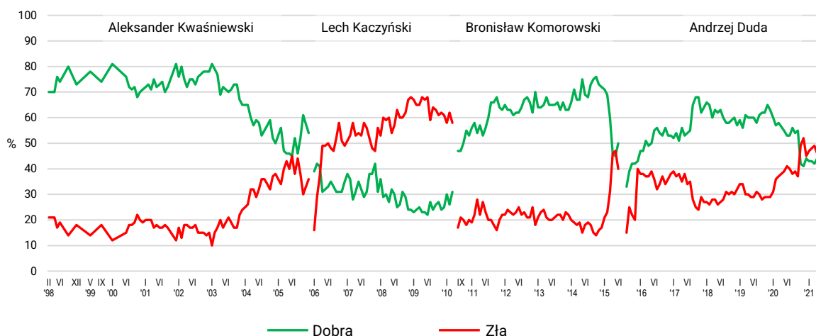
RYS. 3. Oceny działalności prezydenta

Zadowoleniu z prezydentury Andrzeja Dudy najbardziej sprzyja poparcie dla Zjednoczonej Prawicy, prawicowa orientacja polityczna i zaangażowanie (zwłaszcza duże) w praktyki religijne. Wyróżniają się pod tym względem również starsi respondenci (55+), badani mający wykształcenie podstawowe lub zasadnicze zawodowe, mieszkańcy wsi, ankietowani pracujący w prywatnych gospodarstwach rolnych (w tym również rolnicy), robotnicy niewykwalifikowani, uzyskujący niskie (poniżej 1500 zł) lub przeciętne (1500 zł – 1999 zł) dochody w przeliczeniu na osobę w gospodarstwie domowym. Głosy krytyki dominują wśród zwolenników ugrupowań opozycyjnych, szczególnie Koalicji Obywatelskiej, Lewicy i Polski 2050 Szymona Hołowni, wśród osób identyfikujących się z lewicą oraz niezaangażowanych religijnie. Niezadowoleni z obecnej prezydentury relatywnie często są także badani sporadycznie uczestniczący w praktykach religijnych, deklarujący centrowe poglądy polityczne, a poza tym ankietowani poniżej 45 roku życia (zwłaszcza w wieku 18–24 lata), mieszkańcy największych oraz średniej wielkości miast (20 000 – 99 999 ludności), mający wykształcenie wyższe