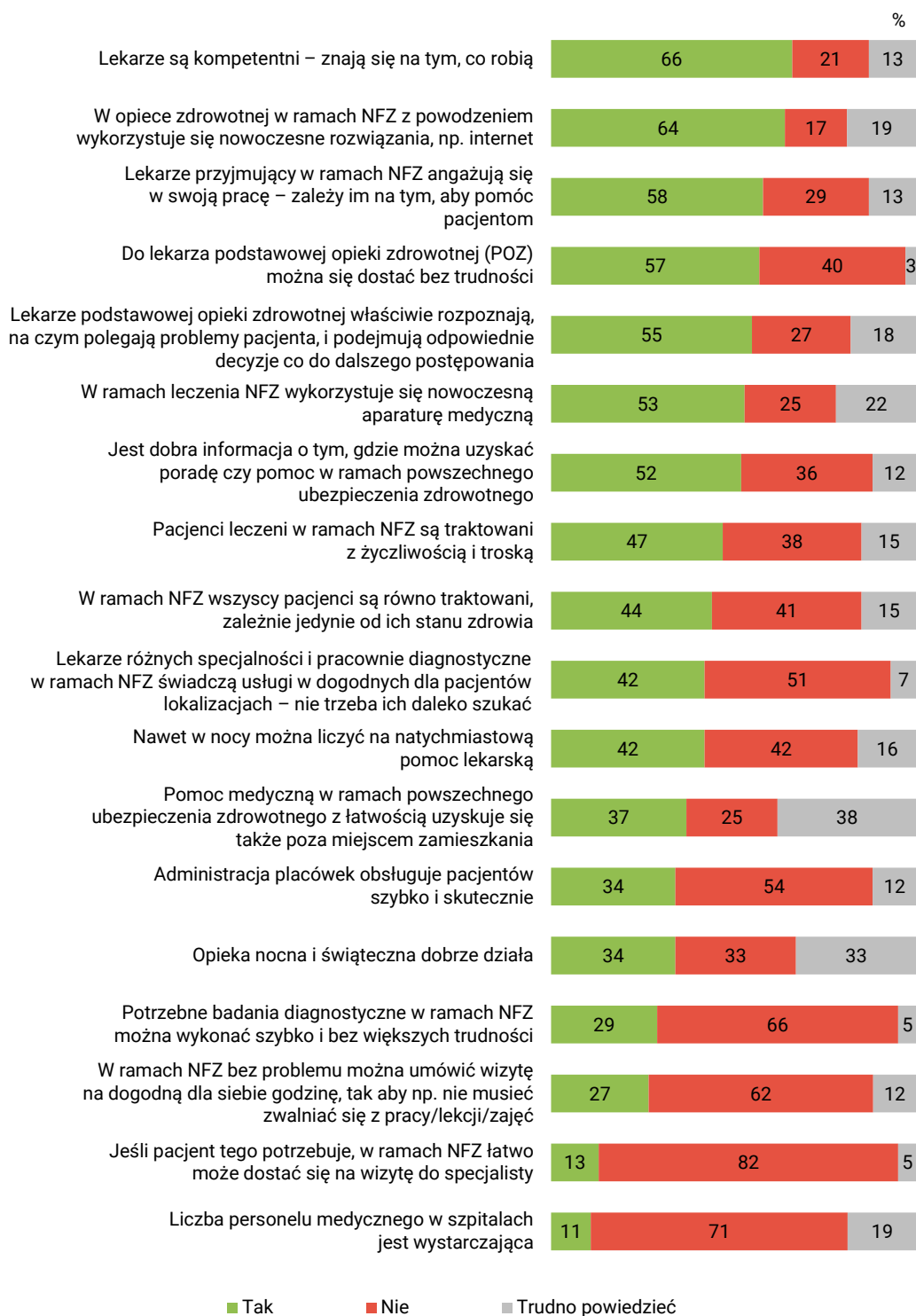
RYS. 2. Czy zgadza się Pan(i) czy też nie zgadza z następującymi opiniami dotyczącymi porad i świadczeń medycznych, jakie otrzymuje się obecnie w ramach powszechnego ubezpieczenia zdrowotnego w Narodowym Funduszu Zdrowia?