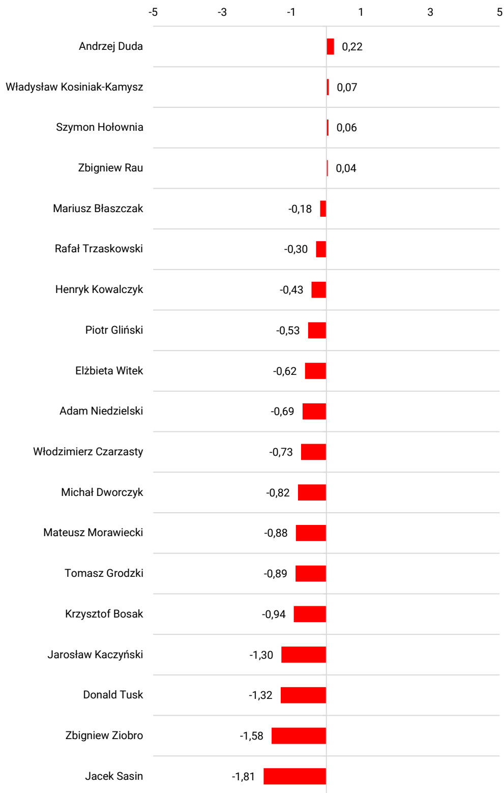
RYS. 1. Zaufanie do polityków w sierpniu 2022 – średnie na skali od -5 (głęboka nieufność) do +5 (pełne zaufanie)