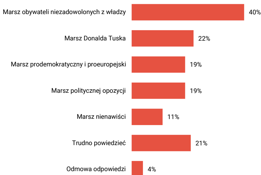
RYS. 3. Jak określił(a)by Pan(i) marsz 4 czerwca? Proszę wskazać te określenia, z którymi się Pan(i) zgadza

Odpowiedzi nie sumują się do 100%, ponieważ respondenci mogli wskazać dowolną liczbę określeń