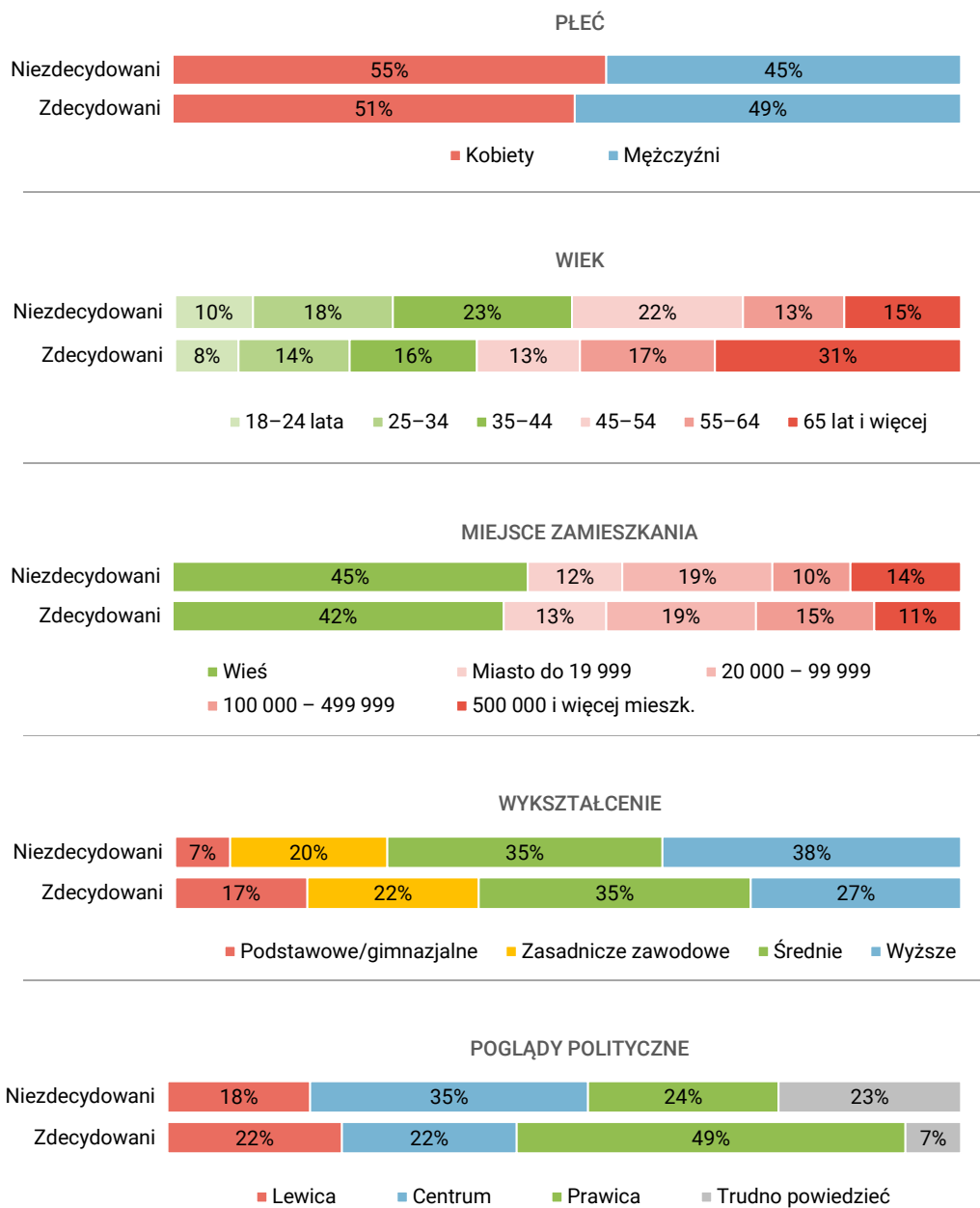
RYS. 1. Charakterystyki socjodemograficzne grupy wyborców o niesprecyzowanych preferencjach partyjnych na tle wyborców zdecydowanych

Odsetki nie sumują się do 100 z powodu zaokrągleń