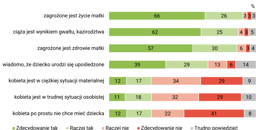
RYS. 2. Jak Pan(i) sądzi, czy przerywanie ciąży powinno być dopuszczalne przez prawo, gdy:

Od ponad dekady stosunek Polaków do aborcji w okolicznościach objętych naszym badaniem charakteryzował się stabilnością. W porównaniu z ubiegłym rokiem nastąpił znaczący wzrost poparcia dla dopuszczalności przerywania ciąży we wszystkich przypadkach. Największa zmiana dotyczy sytuacji, kiedy kobieta po prostu nie chce mieć dziecka – w 2023 roku aborcję w takich okolicznościach popierało 18% Polaków, a obecnie jest to 29%, co oznacza wzrost o 11 punktów procentowych. O 9 punktów procentowych zwiększyło się poparcie dla legalności przerywania ciąży w przypadku, kiedy kobieta jest w trudnej sytuacji osobistej, a o 8 punktów – gdy jest w trudnej sytuacji materialnej. Przekonanie, że aborcja powinna być dopuszczalna przez prawo w pozostałych okolicznościach, również jest mocniejsze niż w poprzednim roku (od 6 punktów w sytuacji, gdy wiadomo, że dziecko urodzi się upośledzone, do 10 punktów procentowych różnicy w przypadku, gdy zagrożone jest życie matki).