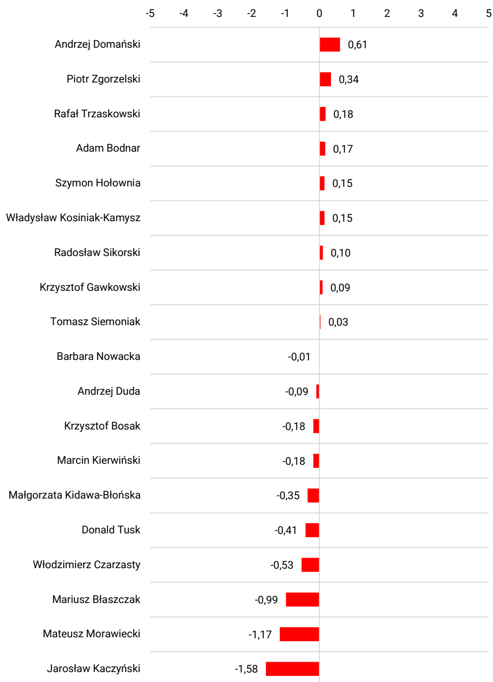
RYS. 1. Zaufanie do polityków w październiku 2024 – średnie na skali od -5 (głęboka nieufność) do +5 (pełne zaufanie)