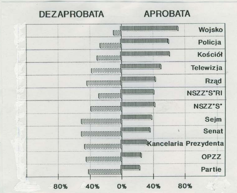
Rys. 1 Ocena działalności kluczowych instytucji i organizacji społeczno-politycznych