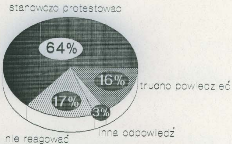
Rys. 1. Rozkład odpowiedzi na pytanie: "Czy w związku ze sposobem traktowania mniejszości polskiej na Litwie przez władze tego kraju rząd polski powinien stanowczo protestować, czy też nie reagować, uznając, że są to wewnętrzne sprawy tego państwa?"

W opiniach o aktualnych stosunkach Polski z ościennymi państwami powstałymi na terenach byłego ZSRR najbardziej krytycznie oceniono właśnie bilateralne relacje polsko-litewskie. Przy czym w przypadku Litwy oraz Ukrainy oceny negatywne były liczniejsze od pozytywnych. Wzajemne kontakty Polski z Federacją Rosyjską i Białorusią oceniono znacznie korzystniej. Należy jednak podkreślić, że w ocenie stosunków ze wszystkimi - poza Litwą - wschodnimi sąsiadami Polski dominowały określenia "ani dobre, ani złe".