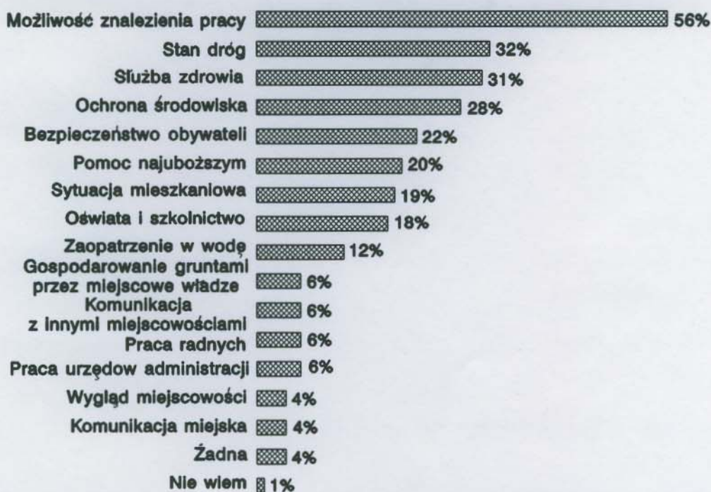
RYS. 1. ROZKŁAD ODPOWIEDZI NA PYTANIE: KTÓRE Z TYCH SPRAW SĄ, PANA(I) ZDANIEM, NAJWIĘKSZĄ BOLĄCZKĄ W PANA(I) MIEJSCU ZAMIESZKANIA?

Respondenci mogli wybrać nie więcej niż trzy odpowiedzi. Problemy uporządkowano według malejącego odsetka wskazań.