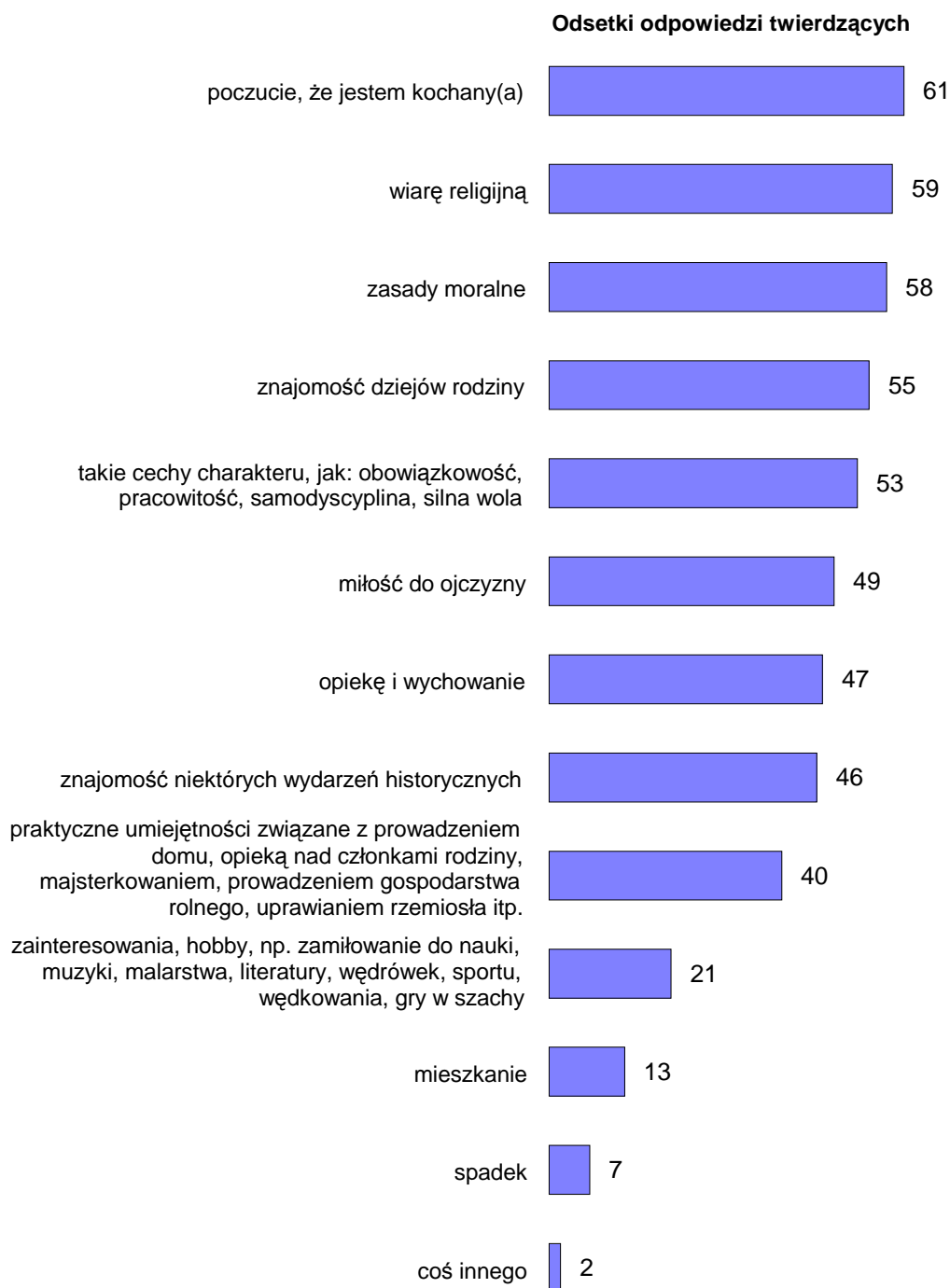
RYS. 2. CZY ZAWDZIĘCZA PAN(I) SWOJEJ BABCI LUB DZIADKOWI:

Odsetki odpowiedzi „trudno powiedzieć” wahają się od 3 do 11