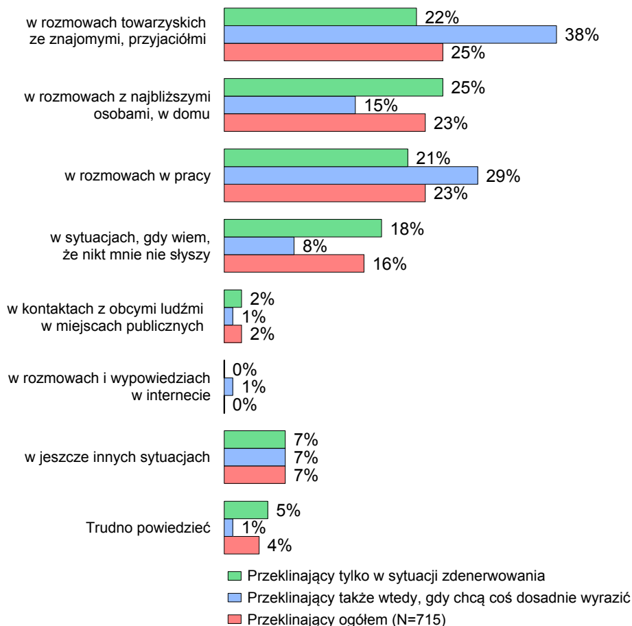
RYS. 2. KIEDY JUŻ UŻYWA PAN(I) SŁÓW NIECENZURALNYCH, PRZEKLEŃSTW TO ZDARZA SIĘ TO NAJCZĘŚCIEJ: