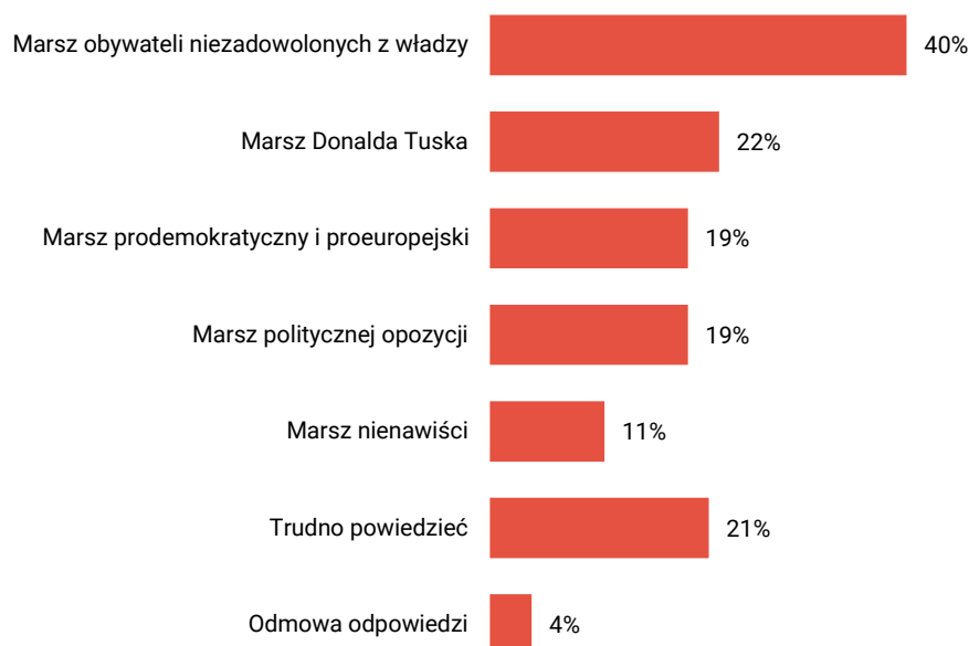
RYS. 3. Jak określił(a)by Pan(i) marsz 4 czerwca? Proszę wskazać te określenia, z którymi się Pan(i) zgadza

Odpowiedzi nie sumują się do 100%, ponieważ respondenci mogli wskazać dowolną liczbę określeń